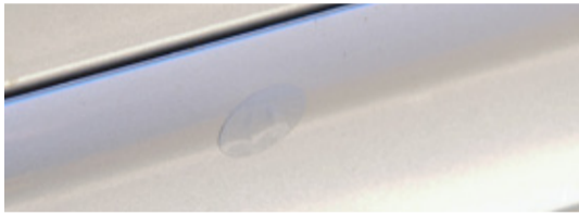
3. Die Schadenstelle ist vor Korrosion geschützt und fast unsichtbar.

Ein Auto, das frisch lackiert aus der Reparatur kommt, hat für seinen Besitzer eine ganz besondere Bedeutung. Nichts soll so schnell wieder am neuen Glück kratzen.