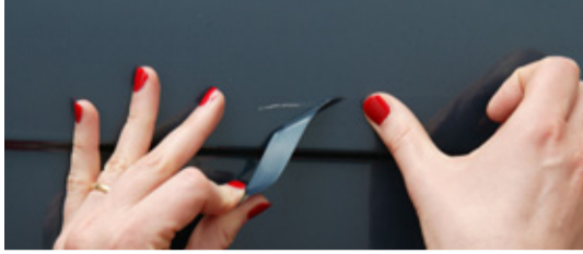
2. spot-ix-Kleber über die Schadenstelle kleben.