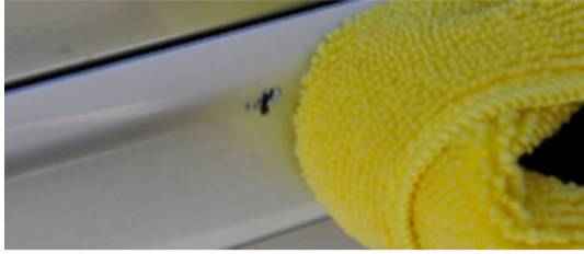
1. Schadenstelle reinigen und trocknen.