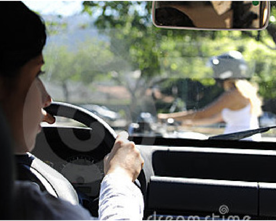
Autofahrer tragen eine grosse Verantwortung im Strassenverkehr.